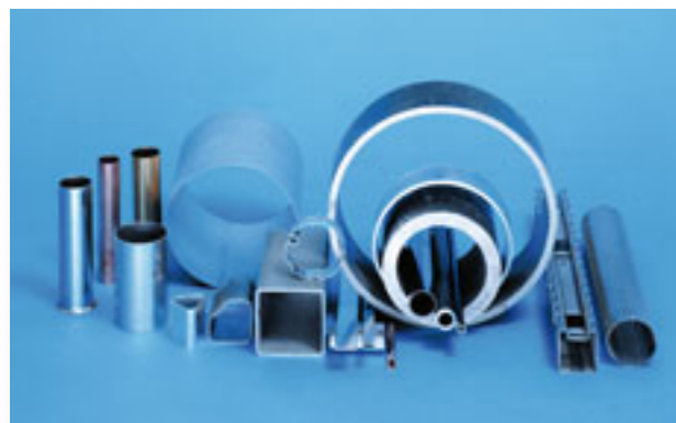
Široký výběr materiálu s velkým rozpětím průřezu a tloušťky stěny

Svařovací generátory Thermatool CFI nejnovější generace jsou přirozenými kandidáty při výběru nového zařízení, schopného svářet uhlíkovou ocel, nerez a boronovou ocel, zrovna tak jako mosaz, měď či hliník. Komplexnější vysoce pevné slitiny, materiály s povrchovou úpravou či pozinkem lze rovněž svařovat nejnovější CFI svařovací technologií.