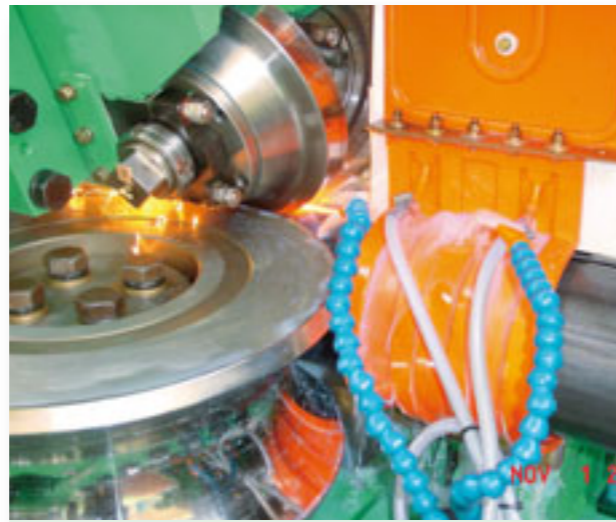
Svařovací uzel pro průměr trubky 160 mm

Výsledkem je často neočekávaně rychlá návratnost investic, která činí Thermatool CFI svařovací agregáty překvapivě dostupné a hodné vážné úvahy.