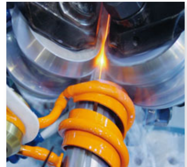
Svařovací hlava pro průměr trubky 76 mm