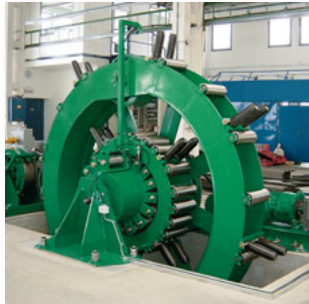
Akumulátor VAK 250 x 3,2