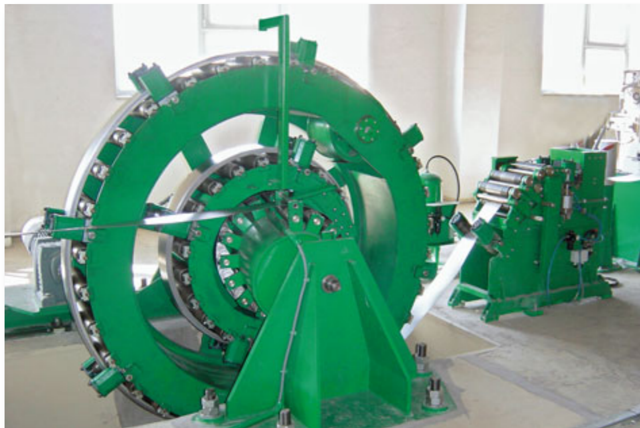
Akumulátor VAK 160 x 2,6