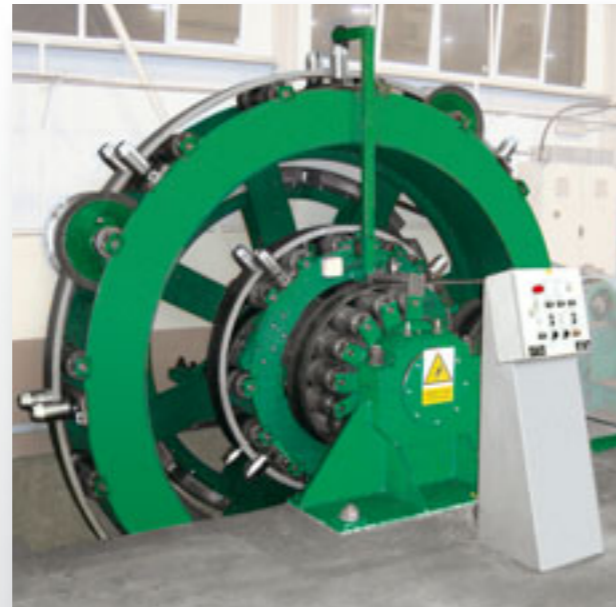
Akumulátor VAK 320 x 4

Vertikální akumulátory VAK pro kontinuální provoz linky využívají novou koncepci řešení, která minimalizuje energetické nároky na akumulaci pásky až o 70 %. Další naprosto zásadní výhodou je snadné řízení chodu rotoru při provozu momentovou regulací pohonu a minimální prostorová zástavba.