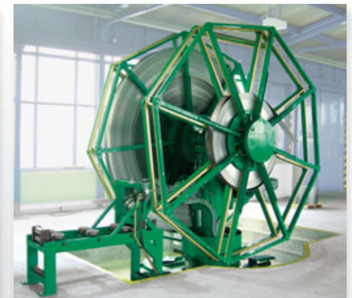
Akumulátor VAB 250 x 3,0