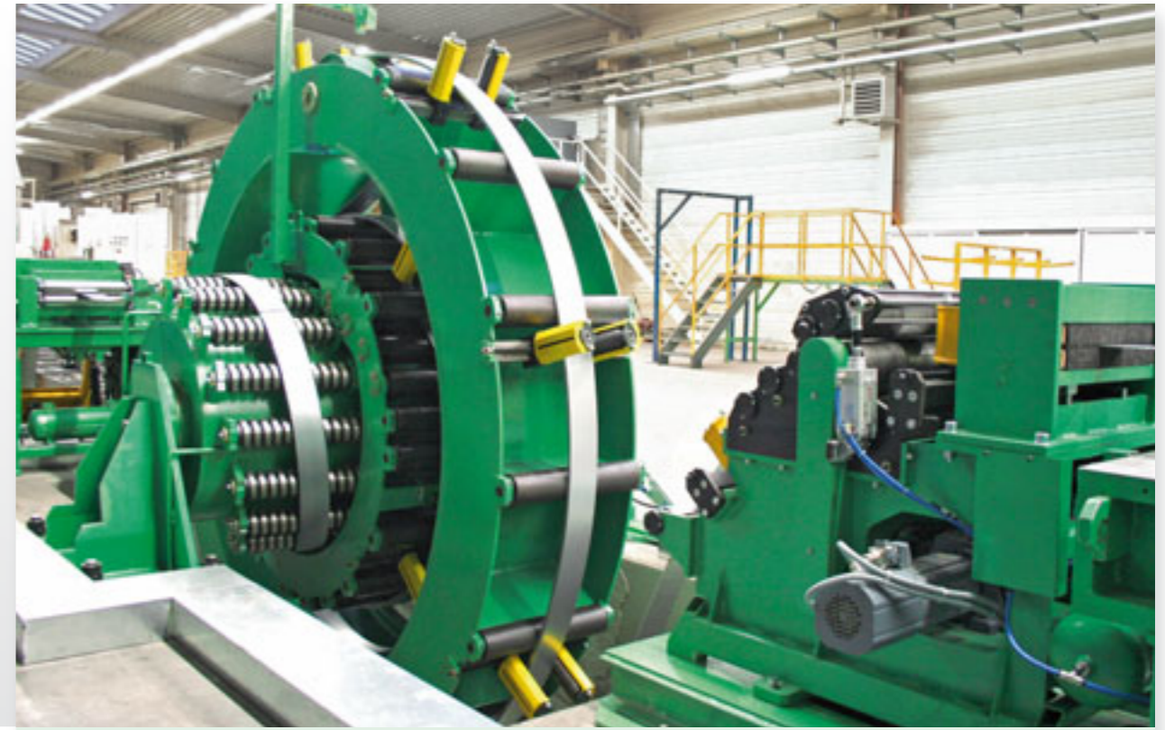
Akumulátor VAK 580 x 4,5